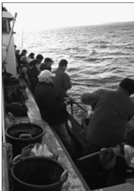
Formanden for fiskeklubben, der har fået 3 villinger på sildeforfanget